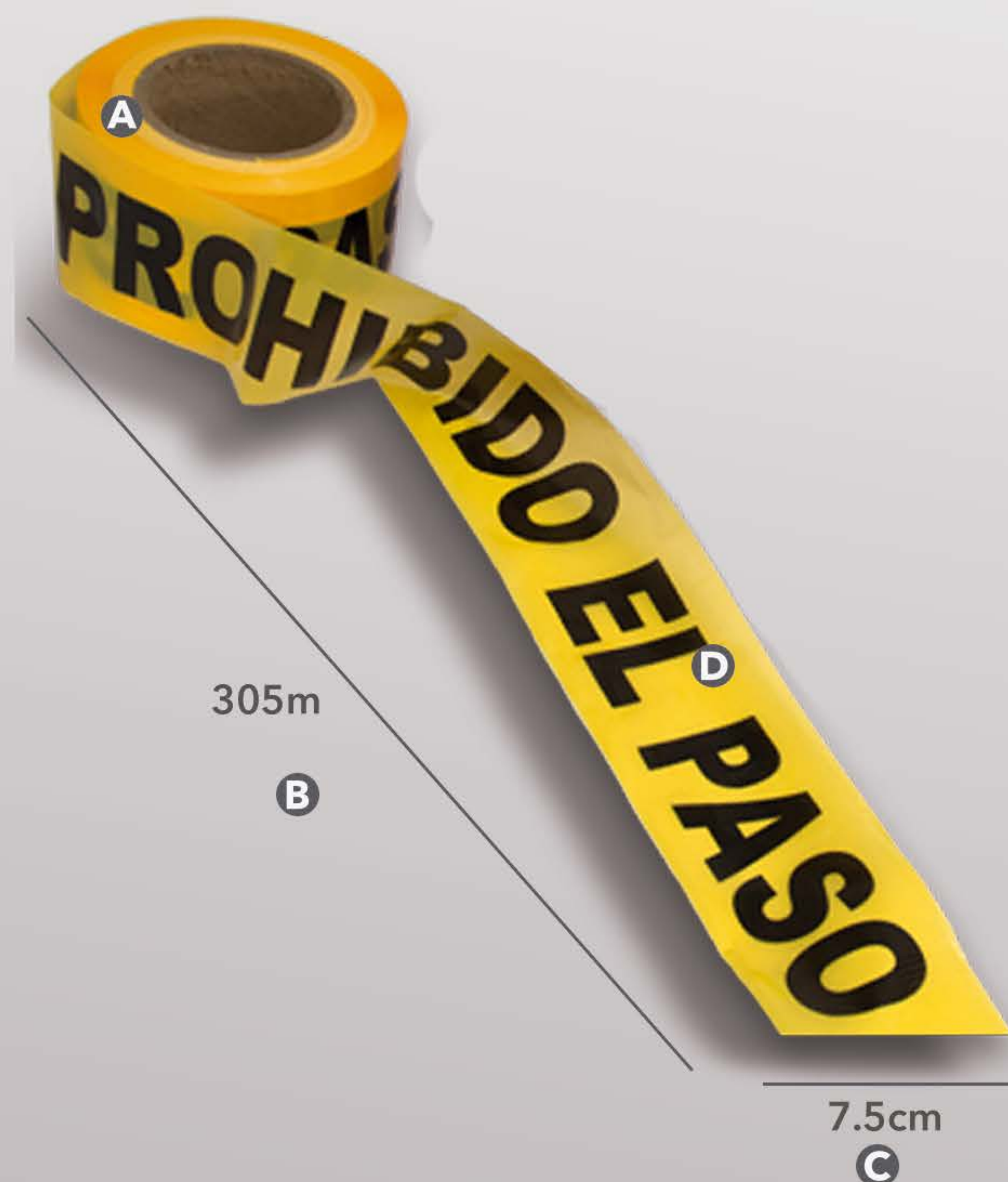
CINTA BARRICADA AMARILLA "PROHIBIDO EL PASO".