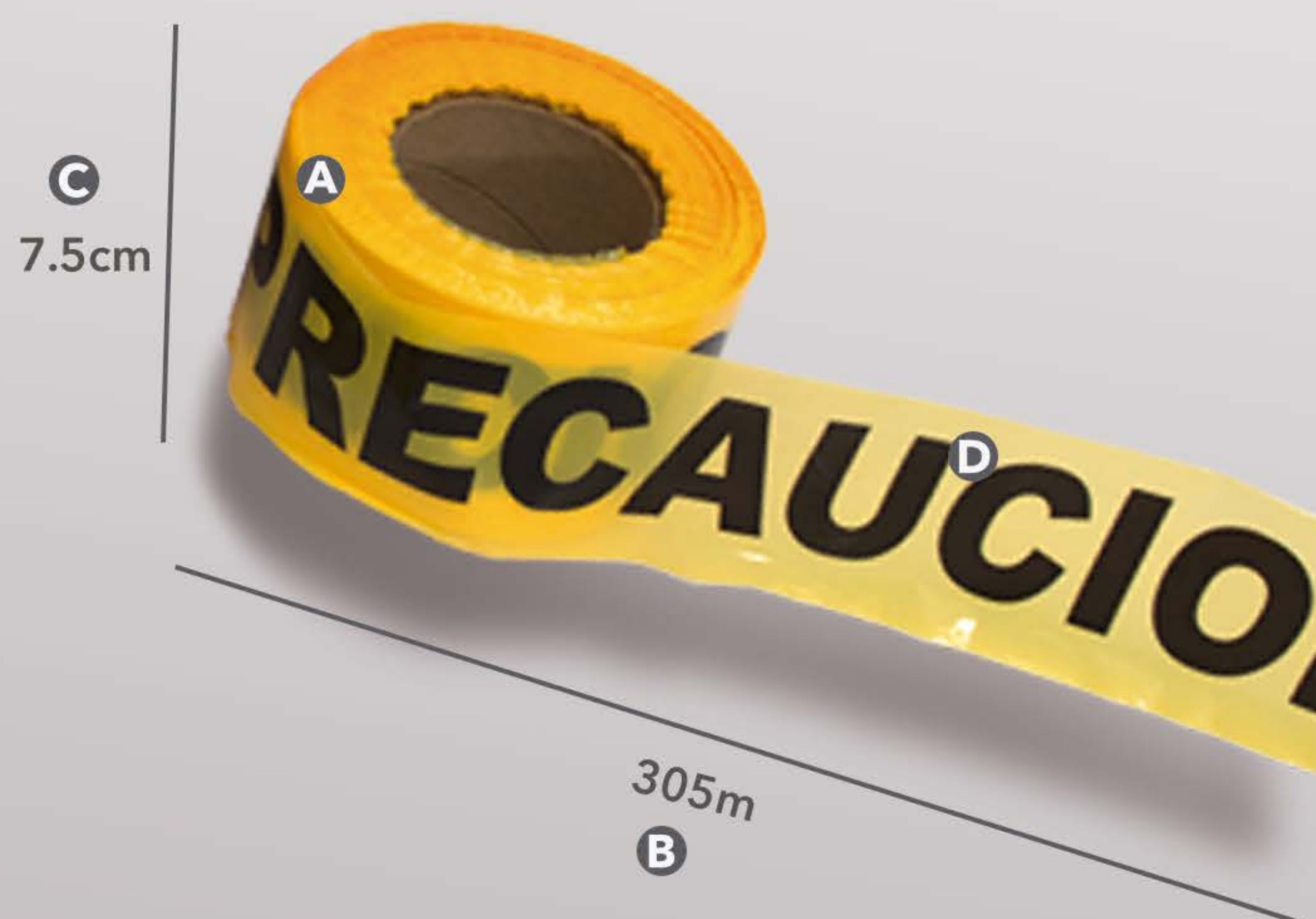
CINTA BARRICADA AMARILLA PRECAUCIÓN