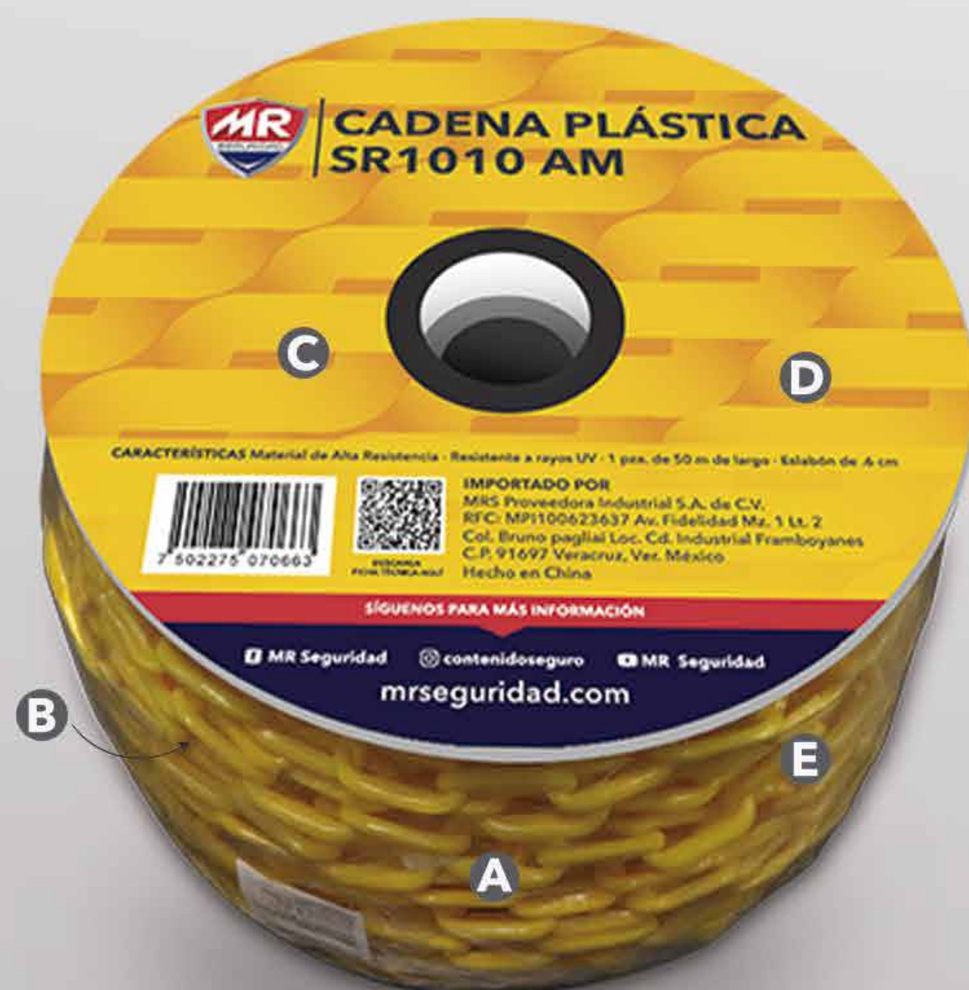
CADENA PLÁSTICA DELIMITADORA