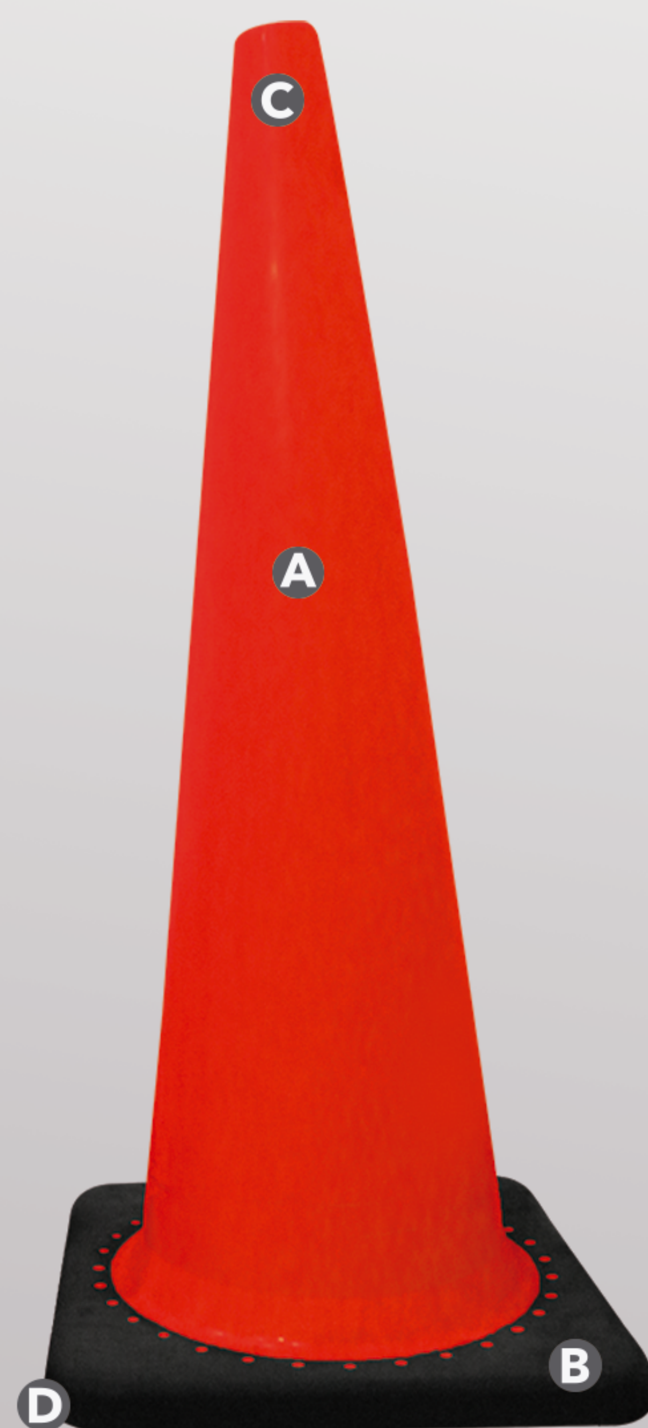
CONO NARANJA DE 90cm FABRICADO EN PVC CON BASE NEGRA